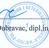
Branka Dubravac, dipl.ing.